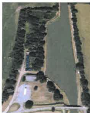
le canal latéral à la Loire